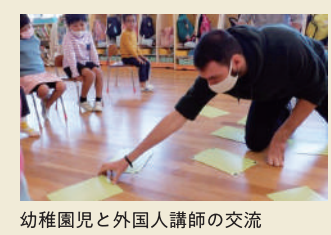
幼稚園児と外国人講師の交流