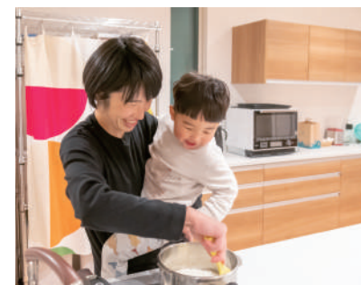
1日の仕事を終わると、畑からすぐの自宅へ。

農業を始めてから、せっかく野菜をつくるならカラダにいいものを栽培したいと模索していくなかで、農業や化学肥料を使わない有機栽培を知りました。野菜の栄養は土から吸収されるので、土作りが大切です。わたしの畑では魚粉、あぶらかす、米ぬか、石灰などを発酵させたボカシ肥料を使っています。いろんな人に野菜を知ってもらいたいという想いから、最近では西区の有機農家グループ「ピオクリエイターズ」にも参加しています。作付け費用として野菜代金を先払いしていただき、あとから定期的に野菜を受け取っていただく、新しい購入方法「CSA FARM-SHARE」に取り組んでいます。将来は研修生を受け入れることで、農園を大きくしたいと思っています。あと今年はコロナ禍のために芋掘りしかできませんでしたが、子どもたちの未来のためになにかできることをしたいです。