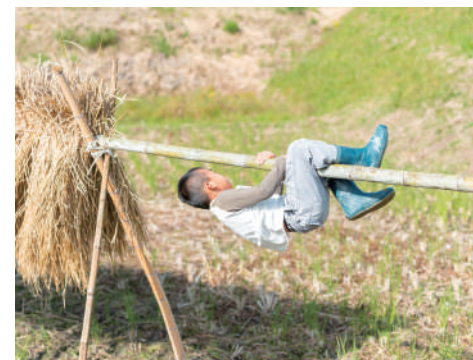
山も、畑も、子どもたちの遊び場に。

仕事柄いろいろな里山や農村地域に行きましたが、地域の皆さんの程よい距離感が大沢町の魅力だと思います。もちろん住宅街に暮らしていた時と比べると、近所の付き合い方に違いはありますが、神戸市内の里山なので外へ働きに出ている方も多く、閉鎖的な集落ではありません。いい意味で世話焼きな方も多いため、子どもがいることもありすぐに打ち解けることができたのがよかったです。神戸近郊からの移住なら仕事も、付き合いも変わらずできることも大きなポイント。息子の元同級生ファミリーは、畑仕事の手伝いや遊びによく来てくれます。コミュニティに入りやすい分、移住した集落の10年後、20年後も考えて主体的に行動できる人に来てもらえたらうれしいです。