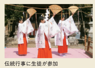
伝統行事に生徒が参加

地域といっしょに、子どもたちの学習と、学校生活をサポートしています。 神戸市立 山田小学校