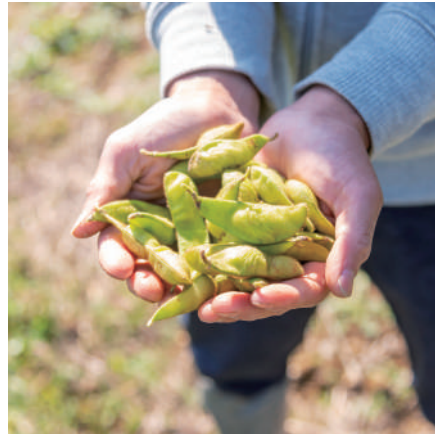
秋に旬を迎える黒枝豆。