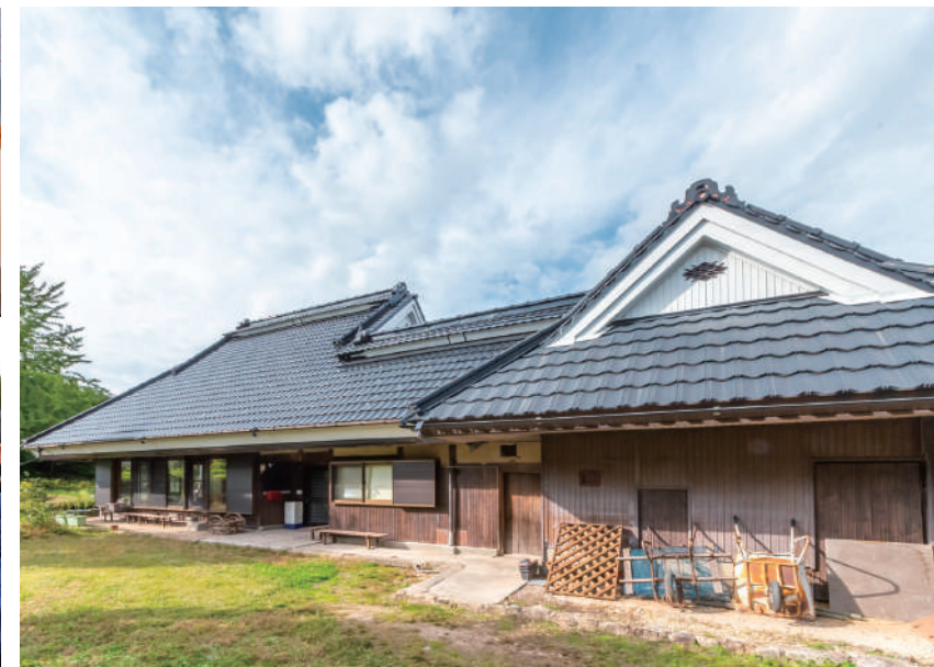
築推定100年の古民家。前の住人がリノベーションし、そのまま移り住む。