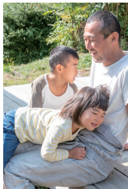
移住することで増えた、親子の時間。