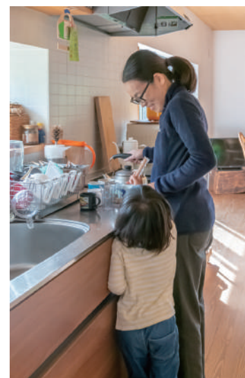
お手伝いも、子どもたちから積極的に。

そのぶん学年関係なく全校生徒で遊べるのが魅力です。また、小さな学校なので統廃合で廃校になることが心配でしたが、隣の新興住宅地の子どものたちも通える制度を地域と神戸市とで取り決めたことも大きかったです。子どもたちは家の中だけではなく、裏山や畑も遊び場にしています。ここに来て自分たちで遊ぶということを覚え、天日干しに使う稲木も稲を脱穀した後は息子の鉄棒になっていますし、自宅で飼っている烏骨鶏の世話や畑では野菜や柿の収穫も手伝ってくれます。農具をさわったり、薪を割って自分で焚き火をしたりすることも里山移住をしたから出来たことだと思います。ここで暮らしだして、ものを買うのではなく、できるだけ自分たちでつくったり、工夫したりする生活をしています。それは子どもたちにも影響を与えていて、余った木材を使っておもちゃを作ったり、森の中へ冒険に出かけたりしている姿を見た時、里山暮らしを選んでよかったと思いました。