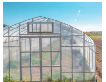
野菜や苗を育てるビニールハウス。