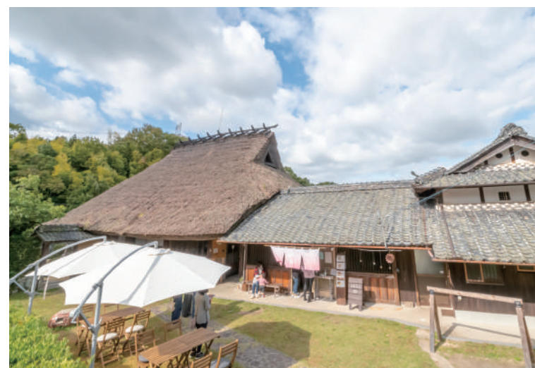
このロケーションとベーグルを求めて、遠方からもお客さんが訪れる。

の息子も家の中を走り回り、自然にふれ、のびのび育っています。ここに来て、季節や時間の流れを感じる生活ができるようになりました。霜がはる、カエルや鳥の声が聞こえる毎日は、自然の中で生きていることを実感できます。店舗自宅のこの家は築230年で、重要文化財に指定されています。茅葺き屋根は30年に1回補修が必要で、メンテナンス費用もかかりますが、ベーグルを買いに来てくれるお客さん、田んぼを貸している若い人や地域の人たちなど、いろいろな人が集えることが財産だと思っています。