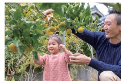
自宅の庭には柑橘類が実る。