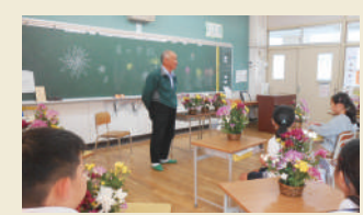
地元の菊農家による課外授業