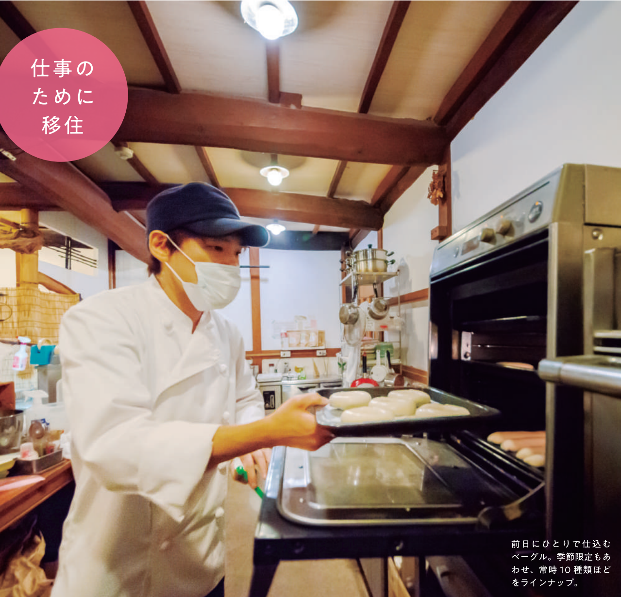
前日にひとりで仕込む ベーグル。季節限定もあ わせ、常時10種類ほど をラインナップ。