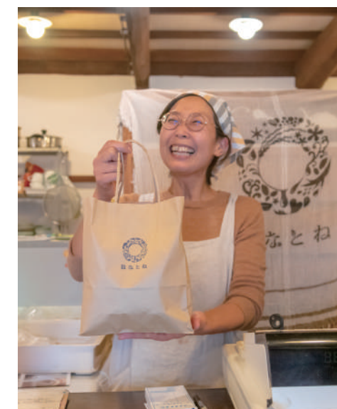
お店を切り盛りする奥さま。

わたしの Howto 移住メモ 相談できる、教えてもらえる人に出会うことが大切です。